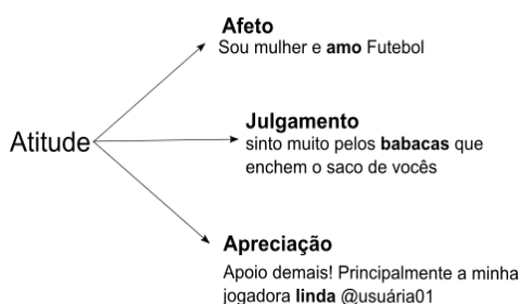
Figura 02: Sistema de atitude no corpus #mulheresnofutebol