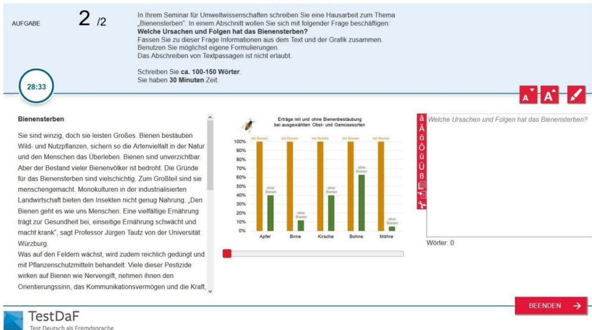
Abb. 1: Benutzeroberfläche der integrierten Schreibaufgabe im digitalen TestDaF

im Lesetext vorzunehmen. Abb. 1 zeigt die Bildschirmansicht für diesen Aufgabentyp.