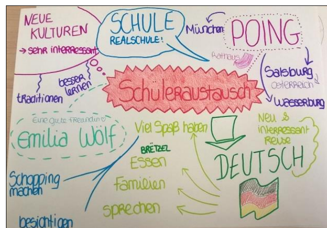
Abb. 1: Assoziogramm 1.

Nachstehend möchten wir drei Assoziogramme kurz analysieren.