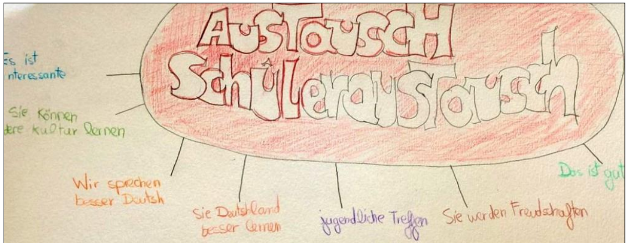
Abb. 2: Assoziogramm 2.

sie besichtigt hat, mit der Sprache und mit dem Essen. Sie schreibt auch „besser lernen“, sie sieht also die Korrelation zwischen dem, was sie erlebt hat, und der Verbesserung der Deutschkenntnisse.