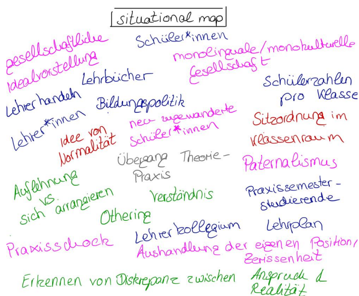
Abb. 1: Messy map als frühe Form einer situational map

Der Prozess des mappings erfolgt auf Basis der generierten Daten sowie Forschungsliteratur und dem Vorwissen des*der Forscher*in, wobei die Art der Einbindung der Daten nicht ganz eindeutig ist (s.u.). Im Forschungsprozess werden die drei Formen von maps (in je verschiedenen Versionen) erstellt, die unterschiedliche Ebenen betrachten bzw. Perspektiven erlauben und damit unterschiedliche Funktionen erfüllen: Die situational map dient dazu, die Situation zu strukturieren und zu erfassen und die Datenerhebung zu steuern (vergleichbar mit Blumers sensitizing concepts (vgl. Clarke et al. 2018: 132)). Abbildung 1 zeigt eine solche map in ungeordneter Form ( messy map ), in die vor der Datenerhebung bzw. in unserem Fall vor der intensiven Beschäftigung mit dem Interviewdatum, erste Informationen einfließen und die dann durch Aspekte aus dem Datenmaterial ergänzt wird.