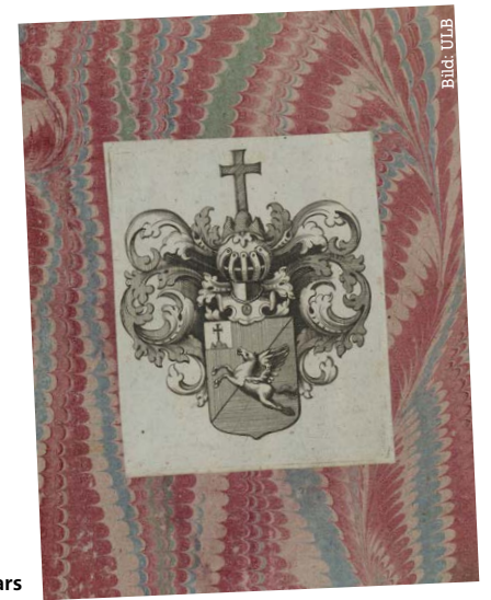
Exlibris des Darmstädter Exemplars