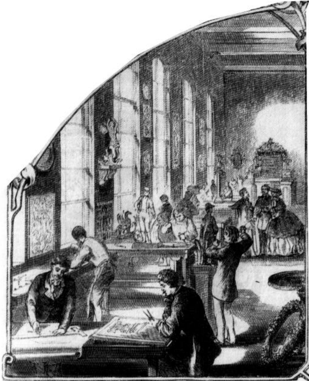
Abbildung 30: Möbelfabrik „Renaissance“ der Gebrüder Lövinson in Berlin, um 1862. Linke Bildhälfte: Entwurfsabteilung und Bildhauersaal mit adeliger oder hochbürgerlicher Kundschaft, an den Wänden Bildhauerproben und Muster, im Hintergrund ein beinahe fertiggestelltes, aufwendiges Möbelstück. Rechte Bildhälfte: Tischlersaal, Ausarbeitung der Möbelteile und Zusammenbau. Im Vordergrund Werkstattleiter, daneben Furnierböcke, Eingang zur Leimküche, Zu-