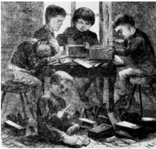
Abbildung 29: Kinder beim Anfertigen von Zigarrenkisten. Infolge der aufblühenden Zigarrenindustrie Bremens während des 19. Jahrhunderts wurde dieser Artikel in großen Mengen gebraucht.