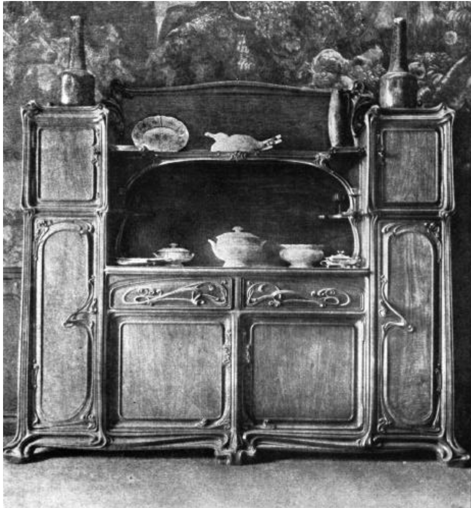
Abbildung 100: Linien der Kontextualität, ein gestikuliertes Ganzes. Hervortreten des Nutzdings aus einem energetisch Allgemeinen. Büfett-Schrank von Gaillard, Paris, 1900.