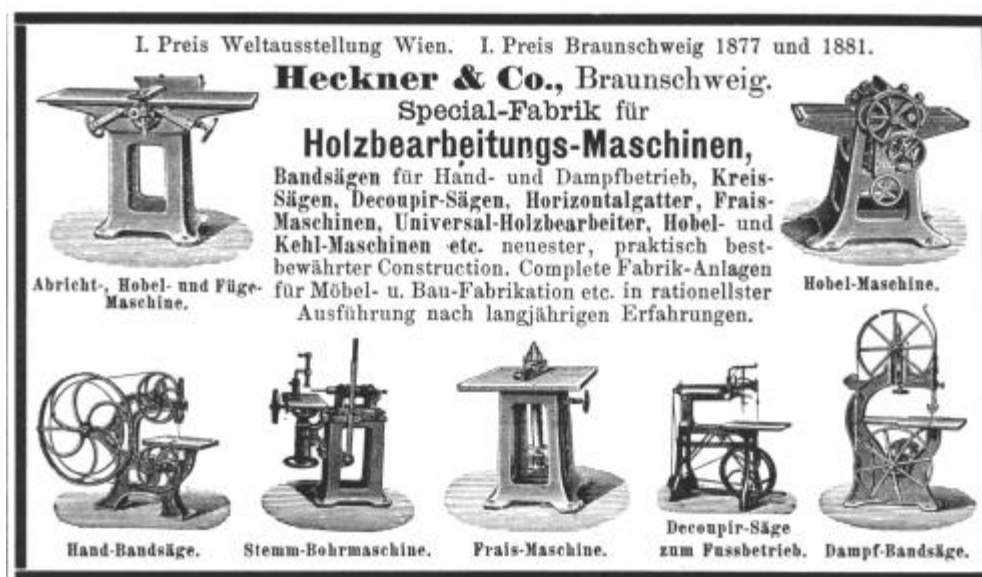
Abbildung 60: Werbung der Firma Heckner & Co, Braunschweig, 1886. Die exponierte Darstellung von Abrichter und Hobelmaschine innerhalb der Anzeige streicht heraus, welche Bedeutung ihnen für die Komplettierung der Holzbearbeitungsmaschinen zum Maschinen-Satz zukam.