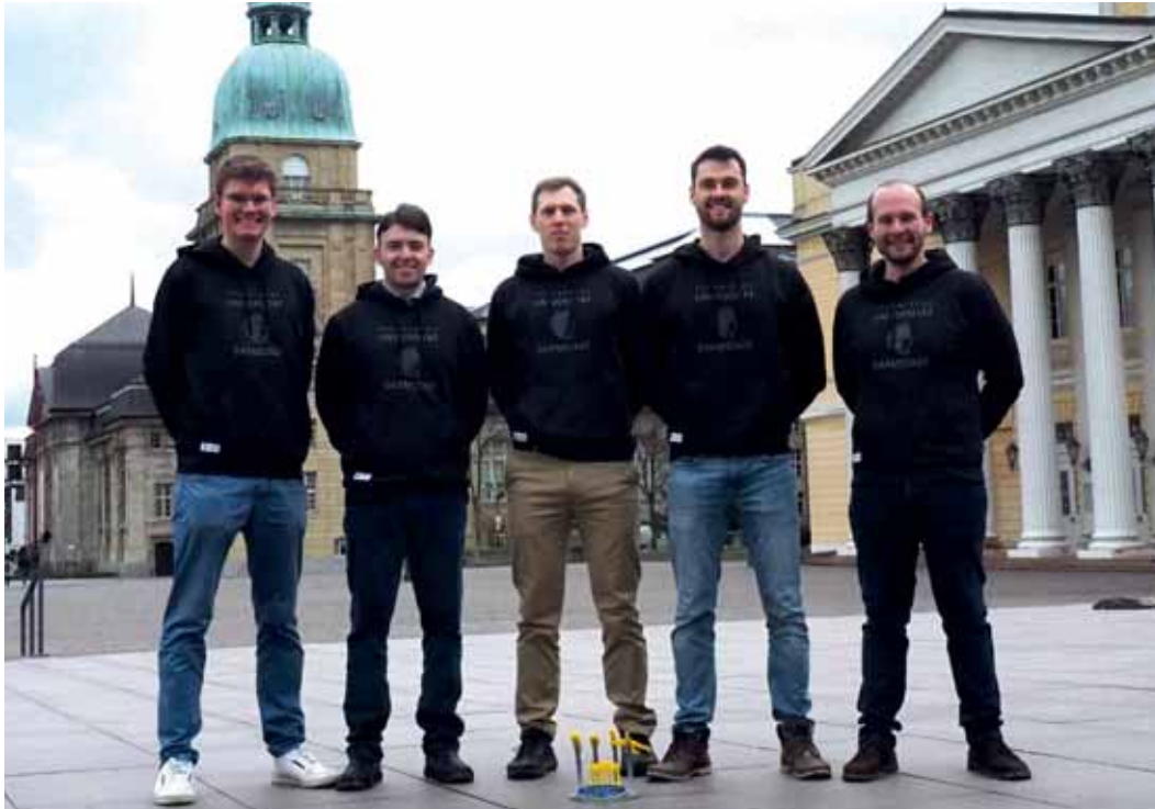
Das Siegerteam von der TU Darmstadt

... unter diesem Titel fand vom 28.02. – 01.03.2020 in Berlin ein Wettbewerb statt, bei dem zehn Teams verschiedener Hochschulen aus Deutschland und Österreich darum rangen, die Jury zu überzeugen. Unter der Organisation von Mobility goes Additive e.V. und der VDI-Gesellschaft Fahrzeug- und Verkehrstechnik entwickelten die interdisziplinär besetzten Studententeams Anwendungsfälle für additive Fertigung.