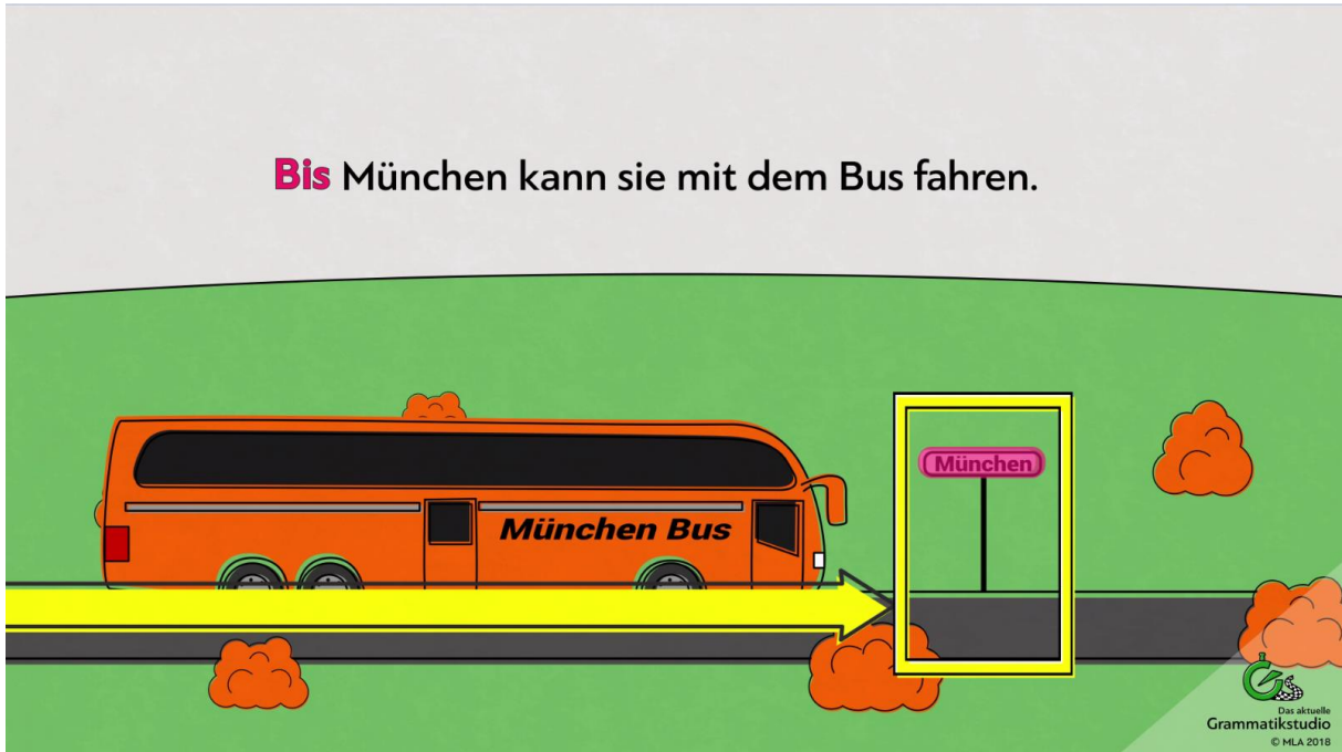
Abb. 5: Präposition bis

bis (Akkusativ) = Richtung/Ziel + Grenze/Linie