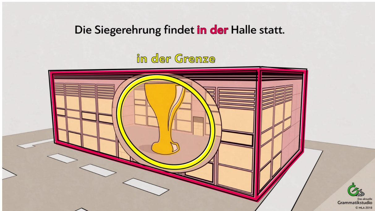
Abb. 11: Präposition in + Dativ

Die Grenzen können real oder imaginär sein. Die Grenze „in der Halle“ ist real. Man sieht die Grenzen der Halle.