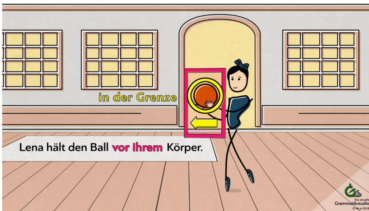
Abb. 4: Präposition vor + Dativ

Die Grenzen können real oder imaginär sein. Die Grenze „vor ihrem Körper“ ist imaginär. Man kann sie sich vorstellen.