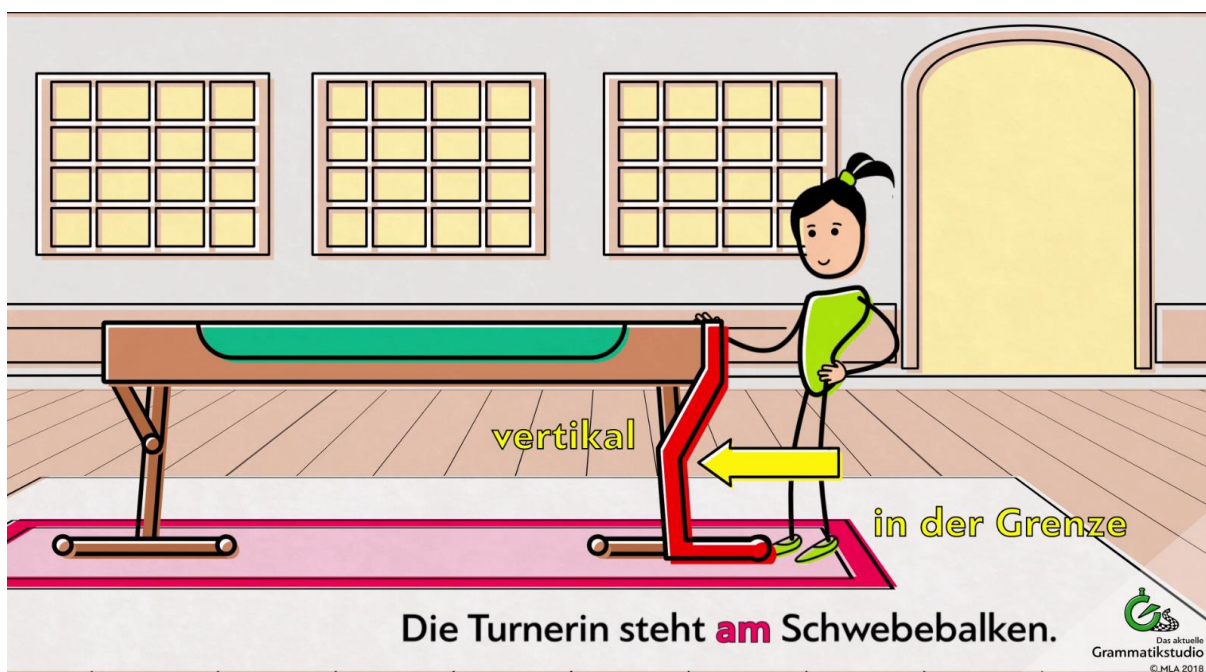
Abb. 7: Präposition an + Dativ

Manche Präpositionen werden eins mit dem Artikel im Dativ. So wird aus an + dem → am .