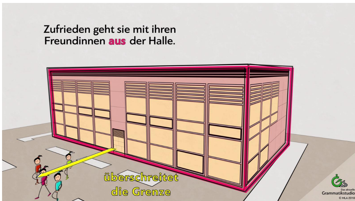
Abb. 9: Präposition aus