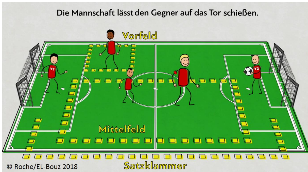
Abb. 2: Deutsche Wortfolge (Satzklammer) am Beispiel von Fußballspiel: Phase 2 der Erklärungen