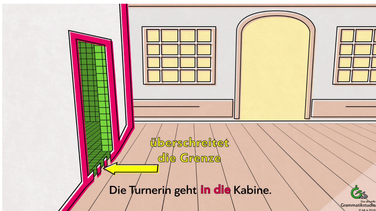
Abb. 10: Präposition in + Akkusativ

Die Grenzen können real oder imaginär sein. Die Grenze „in die Kabine“ ist real. Man sieht die Grenzen der Kabine.