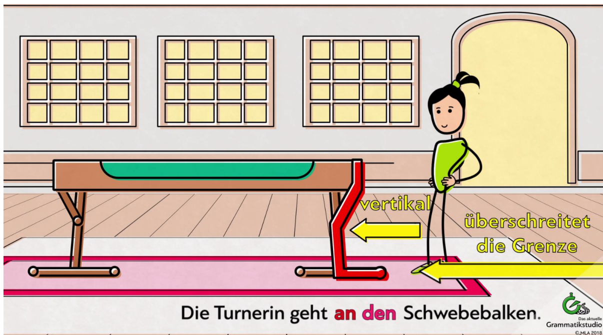
Abb. 6: Präposition an + Akkusativ