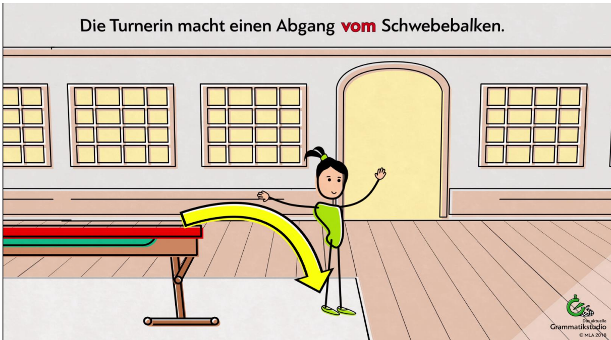
Abb. 8: Präposition von

Auch hier kann mithilfe semantischer Animationen die Bedeutung der Präposition gut mit Pfeilen, weiteren visuellen Aufmerksamkeitsmitteln und der Chronologie der Handlung gut dargestellt werden.