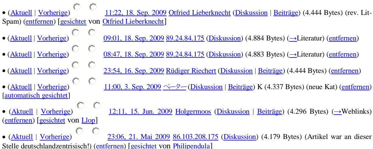
Abb. 1: Auszug aus der Versionsgeschichte des Wikipedia-Artikels ‚Deutsch als Fremdsprache‘ http://de.wikipedia.org/w/index.php?title=Deutsch_als_Fremdsprache&action=history

Bei Wikipedia sind in der Regel keine Zuordnungen zwischen Texten und Autoren möglich, obwohl nicht alle Beiträger anonym agieren. Lässt man sich beispielsweise für den dortigen Artikel Deutsch als Fremdsprache die Versionsgeschichte 4 (Abb1) anzeigen, findet man neben zahlreichen Pseudonymen und IP-Adressen als Autorenreferenz auch Rüdiger Riechert, Mitarbeiter am IIK Düsseldorf, oder Dietmar Rösler, DaF-Lehrstuhlinhaber an der Universität Gießen, als Bearbeiter aufgelistet. Bei Autoren, die unter einem Pseudonym auftauchen, kann über die Wikipedia-Benutzerseite deren Beteiligung an anderen Artikeln eruiert werden, was ebenso einige Rückschlüsse auf deren Fachkompetenz ermöglicht wie die Angaben zur Person, die diese auf den Benutzerseiten freiwillig preisgeben. Diese Recherche ist auch für die Beiträger durchführbar, die lediglich unter einer IP-Adresse firmieren, für diese Gruppe aber in der Regel weniger ergiebig. Obwohl über die Versionsgeschichte die Entstehung eines Artikels genau nachverfolgt und einzelne Passagen bestimmten Personen zugeordnet werden können, bleibt bei Wikipedia in der Regel die Autorenschaft für die Artikel nicht verifizierbar. Dem steht schon die große Zahl an Bearbeitungsschritten entgegen, ausgeführt von einer zwar kleineren, aber durchaus noch stattlichen Zahl an Bearbeitern, von denen die weitaus meisten die Anonymität wählen (u. S. 111 bzw. 117).